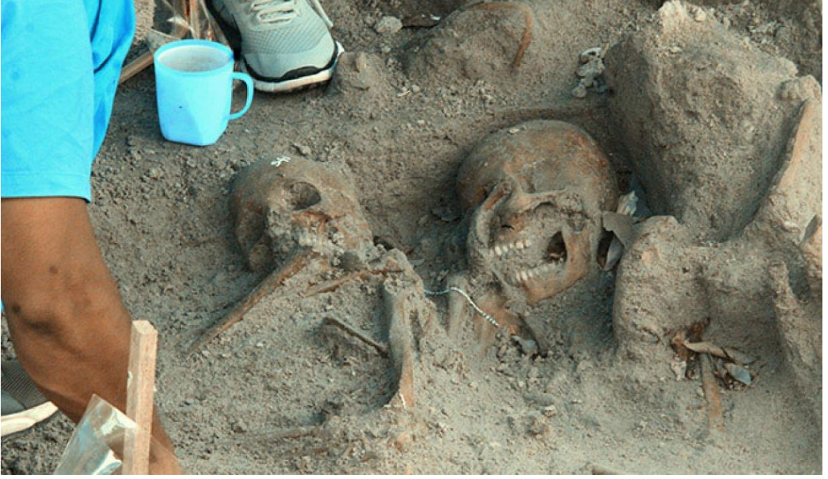
(மன்னார் மாபெரும் புதைகுழி - பிரதிமை அனுசரணை - Sri Lankan Mirror)

பணி குழப்பப்படுவதைத் தடுப்பதற்கே இதழியலாளர்கள் மீது தடை விதிக்கப்பட்டுள்ளதாக நீதிமன்றம் தெரிவித்தது. 26