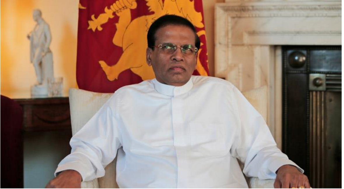
(ஜனாதிபதி மைத்திரிபால சிறிசேன)

கொலை, பாலியல்வல்லுறவு மற்றும் போதைப்பொருட்கள் ஆகியவற்றை அதிகரிப்பதற்காக சமூக ஊடகங்களை ஜனாதிபதி மைத்திரிபால சிறிசேன குற்றஞ்சாட்டினார். “சில சமூக இணையதளங்களும், சட்டவிரோதமான போதைப்பொருட்களின் பயன்பாடும் கொலைகளிலும் பாலியல்வல்லுறவுகளிலும் அதிகரிப்பொன்றை விளைவித்துள்ளன. இந்தத் தீயசக்திகளில் இருந்து சிறுவர்களைக் காப்பாற்றுவதற்கு முன்னுரிமையை வழங்குவது அரசாங்கத்தினதும், பெற்றோரினதும் பொறுப்பாகும்” என ஜூலை 11 அன்று கண்டியில் பொது நிகழ்வொன்றில் ஜனாதிபதி சிறிசேன தெரிவித்ததாக அறிக்கையிடப்பட்டுள்ளது. 24