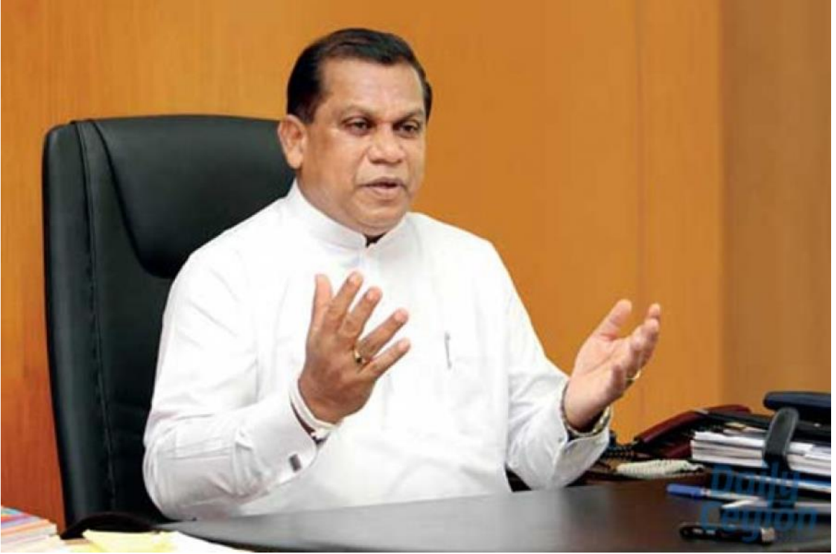
(பிரதிமை - அமைச்சர் ரஞ்ஜித் மத்தும பண்டார )

வடக்கில், விசேடமாக இளைஞர் குழுக்கள் மத்தியில் வன்முறையைத் தூண்டுவதற்காக தமிழ் சினிமாவை சட்டம், ஒழுங்கு அமைச்சர் ரஞ்ஜித் மத்தும பண்டார குற்றஞ்சாட்டியுள்ளதாக அறிக்கையிடப்பட்டுள்ளது. யாழ்ப்பாணத்தில் கோஷ்டி வன்முறையை தமிழ் திரைப்படங்கள் தூண்டுவதாக யாழ்ப்பாணத்தில் 'உண்மையைக் கண்டறியும் தூதுக்குழு' கண்டறிந்துள்ளதாக ஜூலை 13 அன்று கொழும்பில் அவர் விபரித்தார். கொள்ளைகள் போன்ற தமது குற்றவியல் செயற்பாடுகளை மேற்கொள்வதற்கு முன் அச்சத்தை ஊட்டுவதற்காக வன்முறைக் காட்சிகளை தமிழ் இளைஞர்கள் மிக்க ஆர்வத்துடன் பின்பற்றுகிறார்கள். 28,29