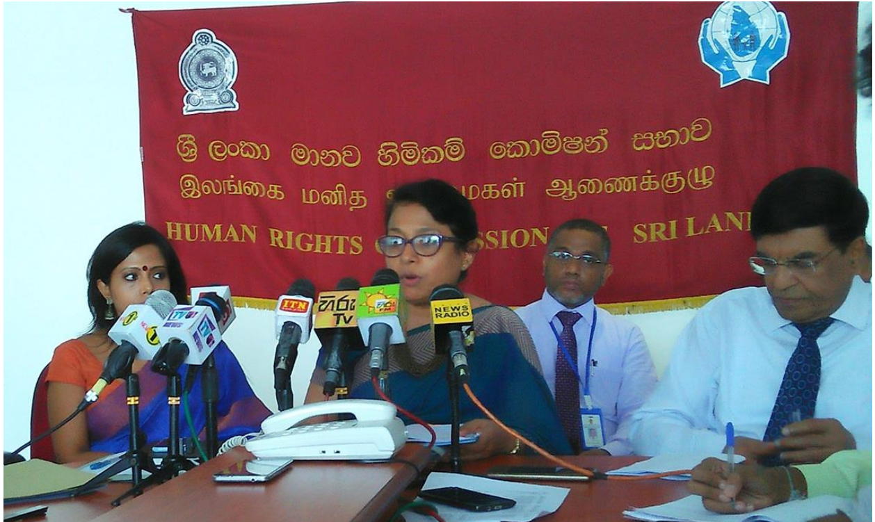
(ආචාර්ය දීපිකා උඩගම, ශ්‍රී ලංකා මානව හිමිකම් කොමිසමේ සභාපති, කොළඹ දී පැවැති මාධ්‍ය හමුවක් අමතමින්.)

ශ්‍රී ලංකා මානව හිමිකම් කොමිසමේ සභාපති ආචාර්ය දීපිකා උඩගම තර්ජනවලට ලක් වී ඇත්තේ ශ්‍රී ලංකා රජයේ ඉල්ලීම මත, ශ්‍රී ලංකා යුද හමුදාවේ එකඟතාවය මත ඇරඹූ පරීක්ෂණ ක්‍රියාදාමයක මානව හිමිකම් කොමිසමේ භූමිකාව නිසාය. ආචාර්ය දීපිකා උඩගමට එරෙහිව මේ තර්ජනයන් කරන ලද්දේ සිවිල් ආරක්ෂක බලකායේ හිටපු අධ්‍යක්ෂක ජෙනරාල් රොයාර් අද්මිරාල් (විශ්‍රාමික) සරත් වීරසේකර විසිනි. 46 ආචාර්ය උඩගම කොටින්ගේ අවශ්‍යතා වෙනුවෙන් දෝහී ලෙස රාජ්‍ය නොවන සංවිධාන සමග වැඩ කරන බවට ද රොයාර් අද්මිරාල් විසින් ප්‍රකාශ කර ඇති අතර, දේශප්‍රේමී රජයක් යටතේ සියලුම දෝහීන්ට මරණ දඩුවම ලැබිය යුතු බව ද ඔහු ප්‍රකාශ කර ඇත 47 . පසුව අගමැතිවරයා මේ මාධ්‍ය නිවේදනයක් නිකුත් කරමින් මේ ද්වේශ සහගත ප්‍රකාශය හෙළා දුටු අතර, එසේම මේ ආකාරයේ තර්ජන සහ එවැනි වගකීම් විරහිත ප්‍රකාශ මුද්‍රිත මාධ්‍යවල ප්‍රකාශයට පත් කිරීම බරපතල කාරණයක් බව කියා සිටියේය. මේ සම්බන්ධයෙන් පරීක්ෂණයක් කරන ලෙස සහ මානව හිමිකම් කොමිසමේ කාර්ය මණ්ඩලයේ ආරක්ෂාව තහවුරු කරන ලෙස ඔහු පොලිස්පතිවරයාට නියෝග කර ඇත 48 .