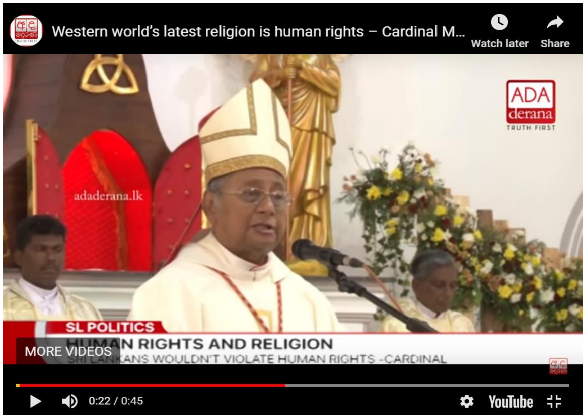
(රූපය- කාදිනල් මැල්කම් රංජිත් - විඩියෝව - අද දෙරණ https://youtu.be/qTVqGUUOWNY )

කොළඹ කතෝලික අගරදගුරු, කාදිනල් මැල්කම් රංජිත් විසින් ප්‍රකාශ කළේ මානව හිමිකම් යන්න පැමිණ ඇත්තේ මෑත දී බවත්, එය බටහිර ආගමක් වන බවත් කියමින්, මානව හිමිකම් යනු ආගමක් නැති අය සැලකිලිමත් විය යුතු මිථ්‍යාවක් බවත්, ආගමක් විශ්වාස කරන අය මානව හිමිකම් ගැන කතා කිරීමට අවශ්‍ය නැති බවත් ප්‍රකාශ කළේය. 50 කතෝලිකයන් කණ්ඩායමක් විසින් මේ අදහස ප්‍රසිද්ධියේ අභියෝගයකට ලක් කර ඇත්තේ, කතෝලික ඉගැන්වීම් සහ මානව හිමිකම් රාමුවට සහයෝගය දක්වන වත්මන් සහ හිටපු පාප් වහන්සේලා විසින් මානව අයිතිවාසිකම් සහ ප්‍රකාශන සම්බන්ධයෙන් කරන ලද ප්‍රකාශ උපුටා දක්වමිනි 51 .