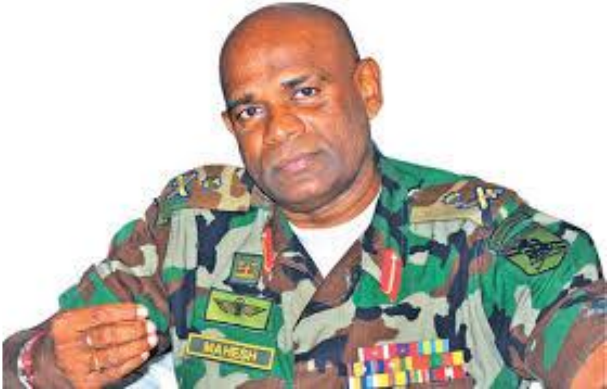
(රූපය- යුදහමුදාපති ලුතිනන් ජෙනරාල් මහේෂ් සේනානායක )

යුද හමුදාපති මහේෂ් සේනානායක විසින් සිදුවෙමින් පවතින සංහිදියා යාන්ත්‍රණයට විශ්‍රාමික නිලධාරීන් ඇතුළුව තනි පුද්ගලයන්, සහ සිවිල් ක්‍රියාකාරීන් විසින් බාධා නොකිරීමට ඉඩ නොදීමට ශ්‍රී ලංකා යුද හමුදාවේ සියලු අංශ වෙත නියෝග ලබා දී ඇති බව වාර්තා වේ “අවස්ථාවාදී දේශපාලනඥයන් සහ ඇතැම් විශ්‍රාමික හමුදා නිලධාරීන් සහ සිවිල් ක්‍රියාකාරීන්, රජය සහ හමුදාව විසින් ගෙන යනු ලබන සංහිදියා ක්‍රියාදාමය විවේචනය කරන ගමන් ත්‍රස්තවාදී ක්‍රියා අගය කරනවා, උතුරු නැගෙනහිර සාමයට කැමති ජනතාව විසින් රජය සහ හමුදාව කෙරේ තබා ඇති විශ්වාසය පළපු කරන ආකාරයේ, වෛරයෙන් ඔවුන්ගේ මනස දූෂණය කරන ආකාරයේ දේශන සහ රැස්වීම් පවත්වනවා,” යැයි හමුදාපතිවරයා විසින් කී බවට වාර්තා වේ. මෙය රජයේ සංහිදියා යාන්ත්‍රණය, සිවිල් වැසියන්ගේ පෞද්ගලික සහ පොදු ඉඩම් අඛණ්ඩව අයිති කර ගැනීම, ගොවිපළ, පෙරපාසැල් ආදියට යුද හමුදාව සම්බන්ධ වීම, සහ ආවේක්ෂණය (surveillance) වැනි කාරණා සම්බන්ධයෙන් යුද හමුදාවේ භූමිකාව සම්බන්ධයෙන් විවේචනාත්මක වූ අයට කළ වක්‍ර තර්ජනයකි 43 44 45 .