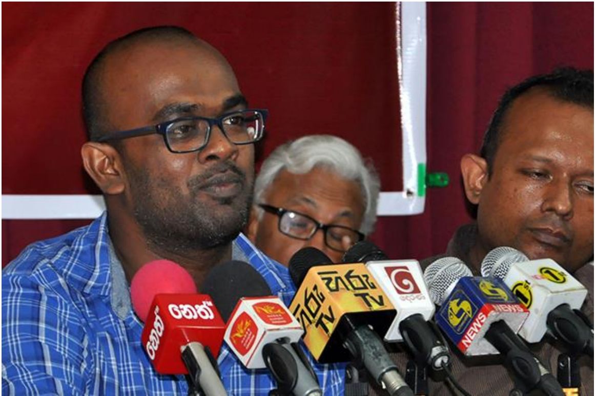
(අසංක සායක්කාර, සිදු වෙමින් පවතින කලාකාරුවන් සහ ලේඛකයන්ට එරෙහි වාරණයට විරුද්ධව කලාකාරුවන් සහ ක්‍රියාකාරීන් කණ්ඩායමක් සංවිධානය කළ මාධ්‍ය සාකච්ඡාවක් අමතමින්, අගෝ 23, කොළඹ දී)

“මම කෙළින් මිනිහෙක්” අසංක සායක්කාරගේ වේදිකා නාට්‍යය එය බුද්ධාගමට අපහාස කරනුයි යන පදනම මත ප්‍රසිද්ධ රැඹුම් පාලක මණ්ඩලය මගින් තහනම් කර ඇතැයි වාර්තා වේ. මේ නාට්‍යය ‘වැඩිහිටියන්ට පමණයි’ යන ලේඛලය යටතේ වර්ග කර ඇති අතර, එය වාර කිහිපයක් වේදිකාවේ රභ දක්වා ඇත. හදිසියේම වාරණ මණ්ඩලය විසින් එහි සහතිකය නැවත කැඳවා ඇත්තේ සමහර දර්ශන බුද්ධාගමට අපහාස කරන නිසාය. මේ වෝදනාව අධ්‍යක්ෂක සායක්කාර විසින් ප්‍රතික්ෂේප කර ඇත. සමහරක් දර්ශන ඉවත් කිරීමේ පදනම පසුව තහනම ඉවත් කරනු ලැබිණි 33 34 .