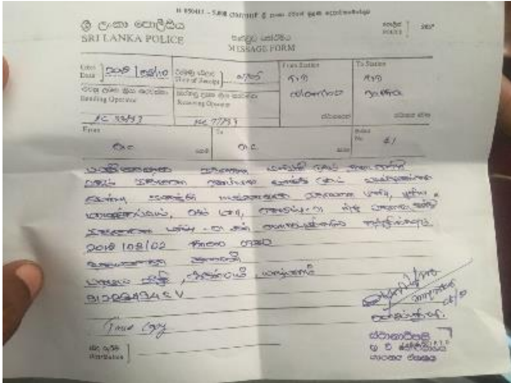
(ශාලින් මහතාට පොලීසියෙන් ලබා දුන් නොනිසිය)

යාපනයේ දෙමළ ජනමාධ්‍යවේදියකු වන උදයරාසා ශාලින් ත්‍රස්ත විමර්ශන කොට්ඨාශය විසින් කොළඹට කැඳවා ඇත්තේ යාපනය දිස්ත්‍රික්කයේ පිහිටි ඔහුගේ ගම වන ආනායිකොට්ටයි හි පිහිටි හින්දු දේවාලයක උත්සවයක දී ඊළාම් සිතියමක් ප්‍රදර්ශනය කිරීම සම්බන්ධයෙන් ප්‍රශ්න කිරීමටය. මේ කැඳවීම සිදු කර ඇත්තේ ත්‍රස්ත විමර්ශන කොට්ඨාශය සහ ප්‍රදේශයේ වෙනත් පොලීස් ස්ථාන විසින් මෙම සිද්ධිය ගැන පරීක්ෂණ සිදු කර සති ගණනකට පසුවය. ශාලින් මහතා මෙම දේවාලයේ කිසිම පරිපාලන කමිටුවක සාමාජිකයෙක් නොවේ. ශාලින් මහතාට අමතරව, දේවලයේ පූජකයා, තරුණ සංගමයේ සාමාජිකයන් මේ සිද්ධිය ගැන ප්‍රශ්න කිරීමට ත්‍රස්ත විමර්ශන කොට්ඨාශය විසින් කොළඹට කැඳවා ඇත 17 .