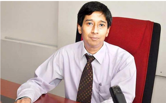
(වෛද්‍ය අනුරුද්ධ පාදෙතිය)

රජයේ වෛද්‍ය නිලධාරීන්ගේ සංගමයේ සභාපති, වෛද්‍ය අනුරුද්ධ පාදෙතිය විසින් මව්බිමේ අරමුණට විරුද්ධව වැඩකරන ජනමාධ්‍යවේදී දෝෂීන්ගේ ලැයිස්තුවක් තමන් ප්‍රකාශයකට පත් කිරීමට සූදානම් බව ප්‍රකාශ කර ඇත. “අපි ලකුණු ක්‍රමයක් හඳුලා තියෙනවා. මනෝවිද්‍යාවේ, රට පවාලා දෙන පුද්ගලයන් හඳුනාගන්නා ක්‍රමයක් තියෙනවා. අපි මේ ලැයිස්තුව අන්තර්ජාලයේ තියනවා ඔවුන් ප්‍රකාශයට පත් කරන දේවලුත් එක්ක. අපිට පෙන්නුම් කරන්න පුළුවන් ඔබ රටට විරුද්ධව කොන්ත්‍රාත්තුවක් ඉටු කරනවා කියා” යැයි වෛද්‍ය පාදෙතිය මහතා ජූලි 4 වැනිදා