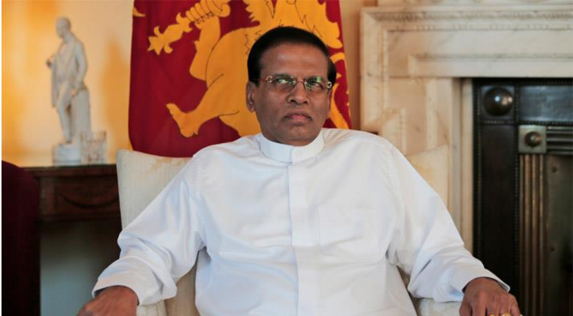
(ජනාධිපති මෛත්‍රීපාල සිරිසේන. )

ජනපති මෛත්‍රීපාල සිරිසේන විසින් මිනීමැරුම්, ස්ත්‍රී දූෂණ සහ මත්ද්‍රව්‍යවල වැඩිවීම සම්බන්ධයෙන් සමාජ මාධ්‍යවලට බැන වද්දු බවට වාර්තා වේ. “සමහරක් සමාජ වෙබ් අඩවි සහ නීති විරෝධී මත්ද්‍රව්‍ය භාවිතා කිරීම නිසා ස්ත්‍රී දූෂණ සහ මිනීමැරුම් වැඩි වෙලා තියෙනවා. වගකීම රජයෙන් ගන්න ඕනා වාගේම දෙමාපියන්ටත් වගකීමක් තියෙනවා මේ වාගේ නරක දේවල් දරුවන් බේරා ගන්න” යැයි ජනපති සිරිසේන මහතා ජූලි 11 වැනිදා නුවර දී පැවැති ප්‍රසිද්ධ උත්සවයක දී ප්‍රකාශ කර ඇත 24 .