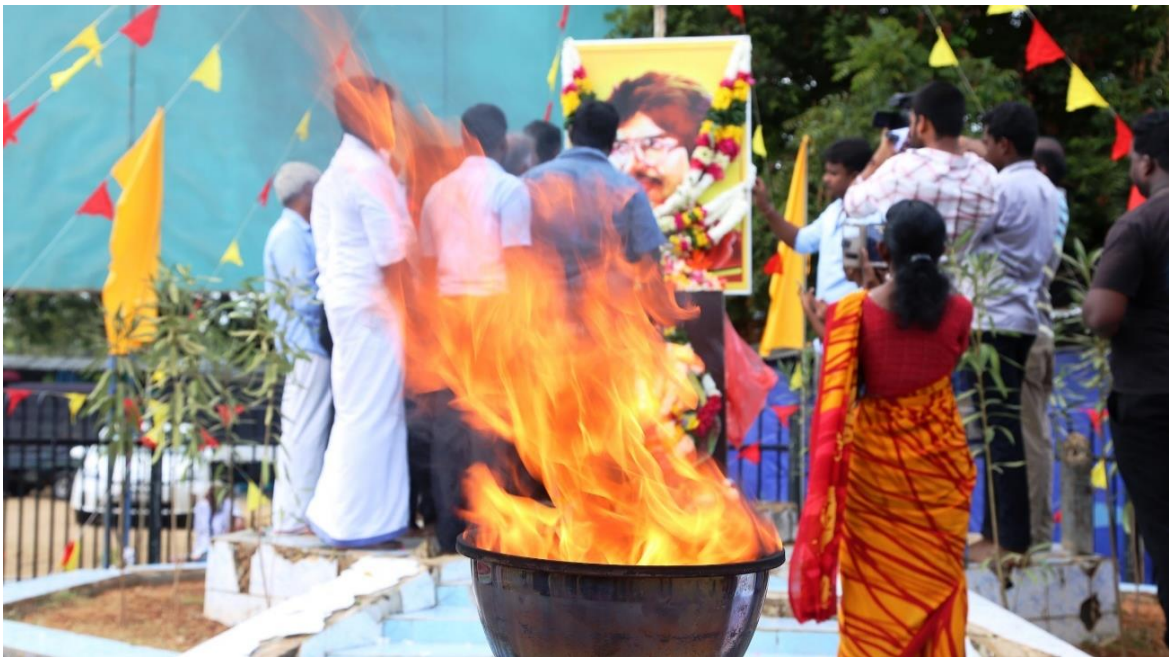
(තිලිපන් සමරුව)

31 වසරකට පෙර ඉන්දීය සාම හමුදාවලට එරෙහිව සිය මරණය තෙක් උපවාසයක නියැලී තිලිපන් සමරීමට එරෙහිව ජූලි 21 වැනිදා පොලීසිය විසින් අතුරු තහනම් නියෝගයක් ඉල්ලා සිටිමින් නඩුවක් පැවැරූ බවට මාධ්‍ය වාර්තා පළ විය. තිලිපන් පෙර එල්ටීටීඊ සාමාජිකයෙකි. යාපනය දිස්ත්‍රික්කයේ නල්ලූර් හිදී සැප්තැම්බර් 26 වෙනිදා මේ සිහිපත් කිරීමේ උළෙල සැලසුම් කර තිබුණි. පොලීසිය විසින් කියා සිටියේ යාපනයට පැමිණෙන සිංහල සංචාරකයන් බියපත් විය හැකි බැවින් සහ වාර්ගික සහ ආගමික සංහිදියාවට උපද්‍රව පැමිණිය හැකි බැවින් මෙම උළෙල තහනම් කළ යුතු බවත්, තිලිපන් ස්මාරකයේ සැරසිලි ඉවත් කළ යුතු බවත්ය. අතුරුතහනම් නියෝගය නිකුත් කිරීම සැප්තැම්බර් 25 වැනි දා උසාවිය විසින් ප්‍රතික්ෂේප කරන ලදී 8 . ඊට පසුදින මේ සිහිපත් කිරීමේ උළෙල යාපනයේ නල්ලූර් කන්දස්වාමි දේවාලය අසල යාපනය නගරාධිපති, දේශපාලනඥයන් සහ කිලිනොච්චි, මුලතිවු සහ යාපනය ප්‍රදේශවල වැසියන්ගේ සහභාගිත්වයෙන් සිදු කෙරිණි 9 .