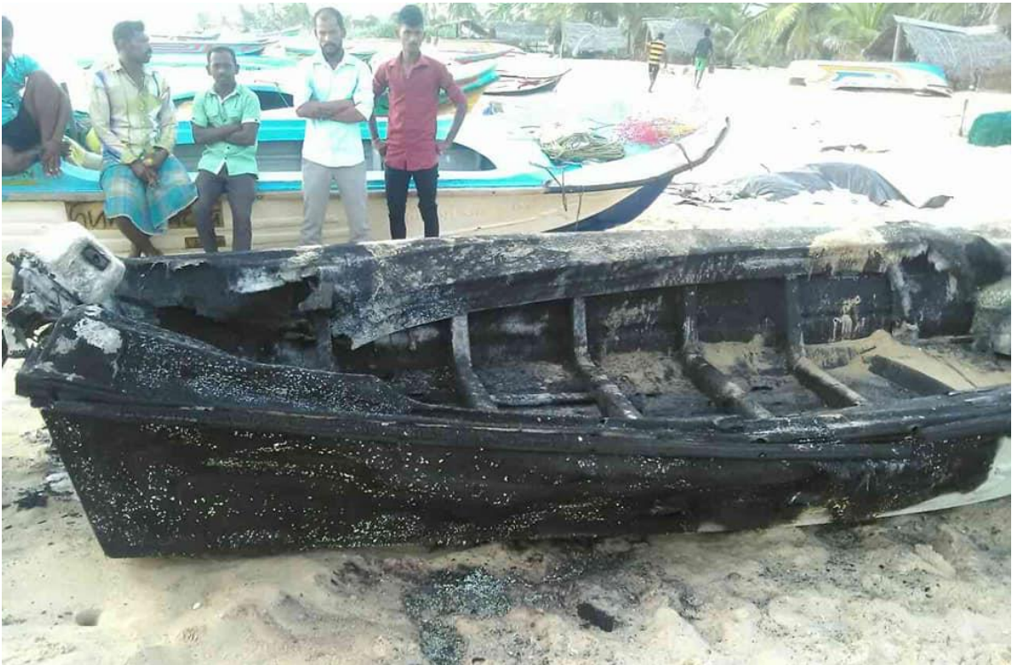
(රූපය- ගිනි තැබූ බෝට්ටුව)

උතුරේ ධීවර අයිතිවාසිකම් වෙනුවෙන් ක්‍රියාකාරීව කටයුතු කරන, දමිළ ධීවරයකු වන සුජීපන් සෙබමාලේට අයිති ධීවර බෝට්ටුවක් ජූලි 21 වැනිදා, යාපනයේ වඩමාරවිචි නැගෙනහිර ප්‍රදේශයේ කඩ්ඩායික් කාඩුහි, මුල්ලියන්හි දී ගිනි තබා තිබුණු බවට වාර්තා වේ. මේ සිද්ධිය සිදු වී ඇත්තේ නාවික හමුදා බණ්ඩයට ආසන්න ස්ථානයක වන අතර, සිදු වූ අලාභය ඇස්තමේන්තුගත ආකාරයට රුපියල් 400,000කි. වඩමාරවිචි නැගෙනහිර ප්‍රදේශයේ මහා පරිමාණයේ මුහුදු කුඩැල්ලන් ඇල්ලීමේ කටයුතු නිසා ධීවර පරිසර පද්ධතිය විනාශ වීම සහ ධීවර ජීවිකාවට සිදුවන සෘණාත්මක බලපෑම ගැන සිදු කළ විරෝධතාවලට සුජීපන් විසින් නායකත්වය ලබා දී ඇත 1 .