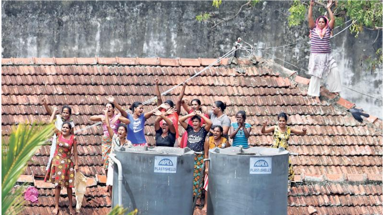
(අඩු පහසුකම් සහ ඔවුන්ගේ අයිතිවාසිකම් සහ යහපැවැත්ම ගැන අනෙකුත් කාරණා සම්බන්ධයෙන් විරෝධතා දක්වන කොළඹ වැලිකඩ බන්ධනාගාරයේ කාන්තා රැඳවියන්, ඡායාරූප දායකත්වය - රුක්මාල් ගමගේ, ඩේලි නිවුස්)

කොළඹ වැලිකඩ බන්ධනාගාරයේ කාන්තා රැඳවියන් කණ්ඩායමකට ඇතැම් නිලධාරීන් විසින් බන්ධනාගාරය ඇතුළත දී සහ, වැලිකඩ බන්ධනාගාරයේ සිට වෙනත් බන්ධනාගාරයක් වෙත ගෙන යමින් තිබිය දී අමානුෂික ලෙස පහර දී ඇත. කාන්තා රැඳවියන් කණ්ඩායම සති දෙකකට වැඩි කාලයක් අඩු පහසුකම් සහ ඔවුන්ගේ අයිතිවාසිකම් සහ යහපැවැත්ම ගැන අනෙකුත් කාරණා සම්බන්ධයෙන් උද්ඝෝෂණය කරමින් සිටියහ. බන්ධනාගාර අධිකාරීන් විසින් විරෝධතාවය විසුරුවා හරින ලද අතර, විරෝධතාකරුවන්ට අමානුෂික ලෙස පහර දුන් බවට වාර්තා වේ. විරෝධතාවය විසුරුවා හැරීමෙන් පසු, අගෝස්තු 20 වැනිදා කාන්තා රැඳවියන් 52ක් වැලිකඩ සිට වෙනත් බන්ධනාගාර වෙත මාරු කරන ලද අතර, එසේ ගෙන යාමේදී ඔවුන්ට බසය තුළදී පිරිමි බන්ධනාගාර නිලධාරීන් විසින් පහර දී ඇත. මාලි නම් වන 35 හැවිරිදි කාන්තා රැඳවියෙක් අගෝස්තු 24 වැනිදා මිය ගිය බවට වාර්තා වෙන්නේ පහර දීම නිසාය. 4142